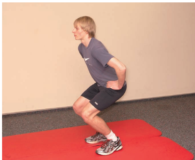
Abb. 1 Höhere Gelenkbelastung trotz gleicher Gewichtsbelastung: Bei einer Kniebeuge zwischen 0 und 30° wird das Kniegelenk mit etwa 100 bis 150 Prozent des Körpergewichts belastet. Bei einer Kniebeuge zwischen 55° bis 100° beträgt die Gelenkbelastung bereits 200 bis 250 Prozent [10].